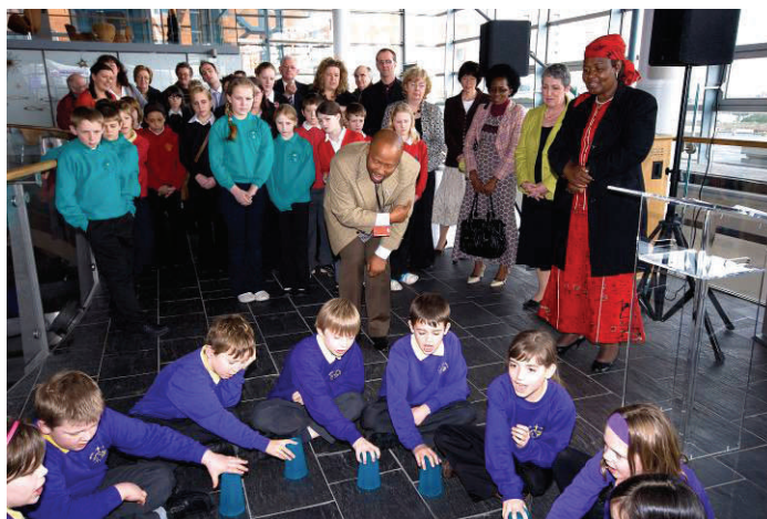
'Plant o Ysgol Pencae yn perfformio cân actol o Lesotho'