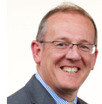
Aled Roberts Democratiaid Rhyddfrydol Cymru Gogledd Cymru