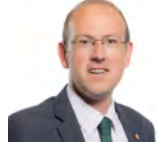
Llyr Gruffydd AC Plaid Cymru Gogledd Cymru