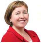
Lynne Neagle AC (Cadeirydd) Llafur Cymru Torfaen