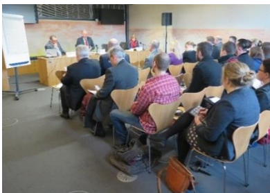
Y Pwyllgor Iechyd a Gofal Cymdeithasol - Ymchwiliad i sylweddau seicoweithredol newydd - Lansio'r Adroddiad, 2015.