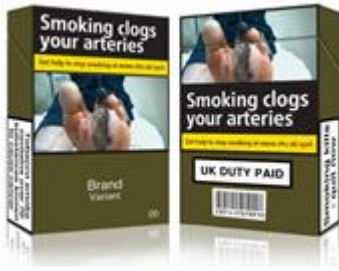
Ffigur 2: Effaith ymchwil ar ddeunydd pacio tybaco safonol

Gwnaeth digwyddiadau yn Senedd y DU yn 2013 helpu i godi ymwybyddiaeth o ymchwil ar ddeunydd pacio tybaco safonol, a ddaeth i rym yn 2016.